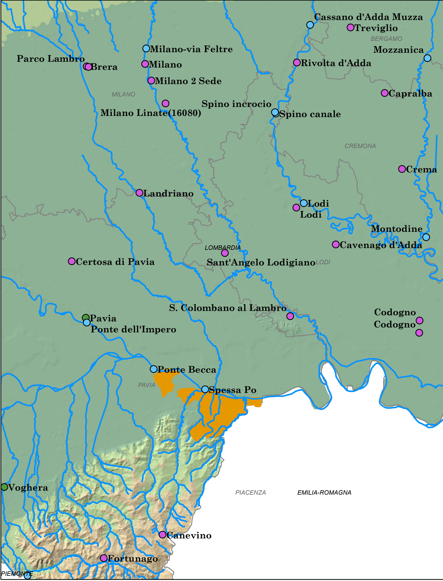
Rete di Monitoraggio Idrometeorologica